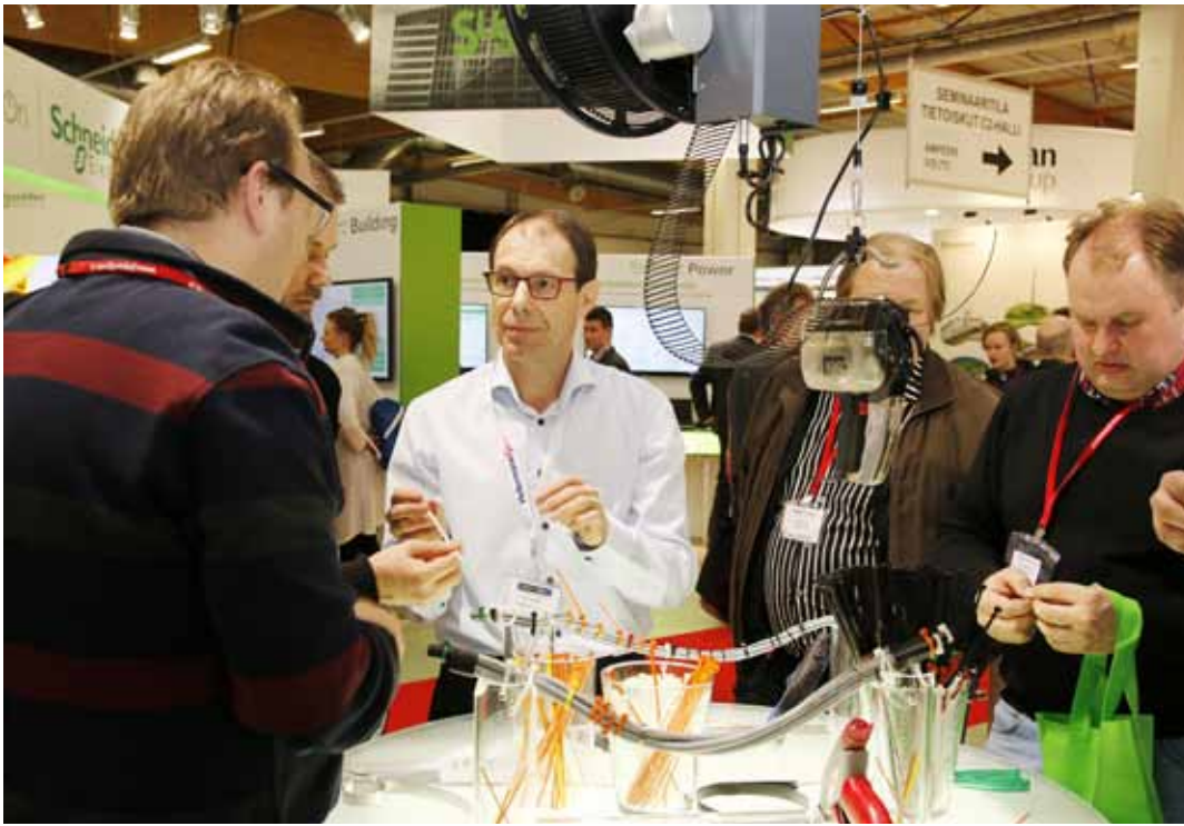
Tikusta asiaa! Juuri tästä messuissa on kyse: näytteilleasettajan ja messuvieraan kohtaamisesta.